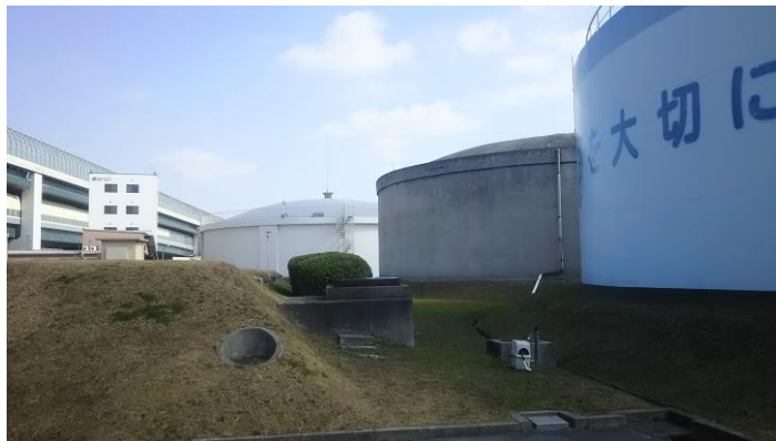
上馬伏配水場 PC 配水池