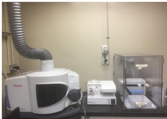
ICP 発光分光分析装置