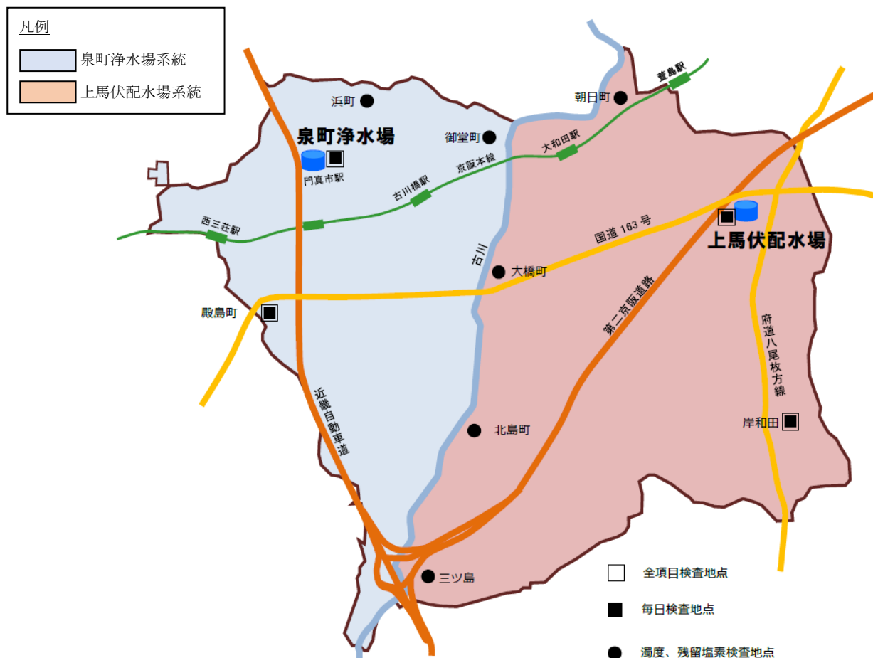
図 1 水質検査地点（配水系統図）