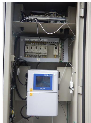
連続自動測定機器

上記の水質基準項目検査地点4カ所に加え浜町、御堂町、朝日町、大橋町、北島町、三ツ島の計10地点で検査を行います。