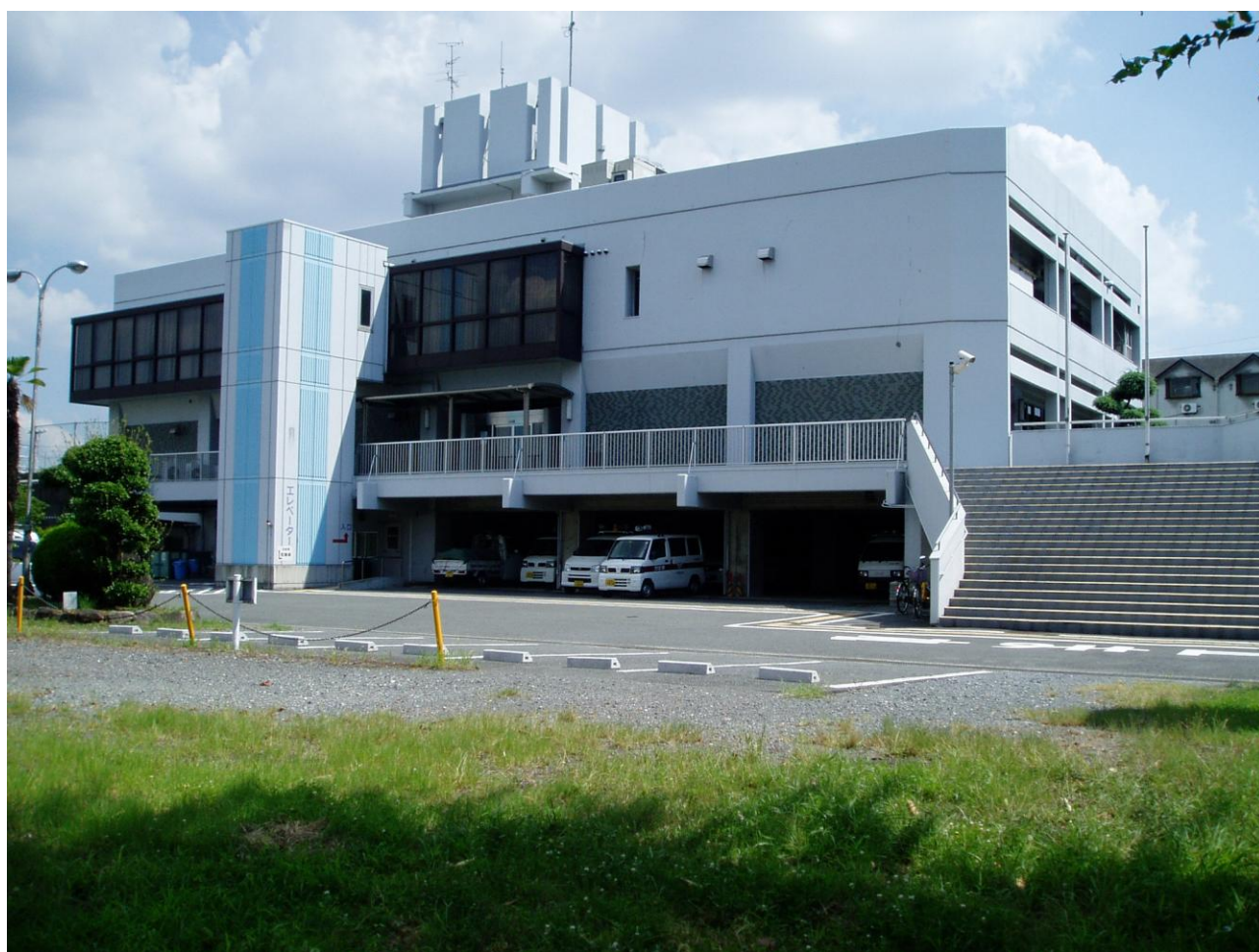
泉町浄水場 管理棟