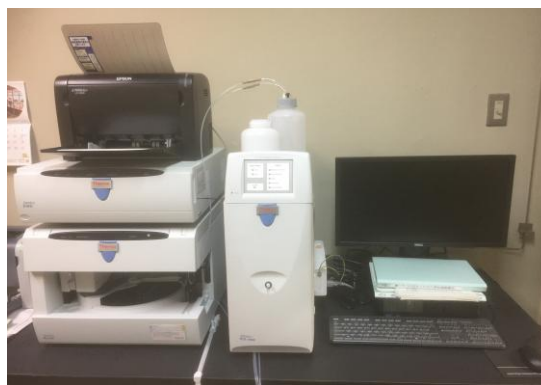
イオンクロマトグラフ