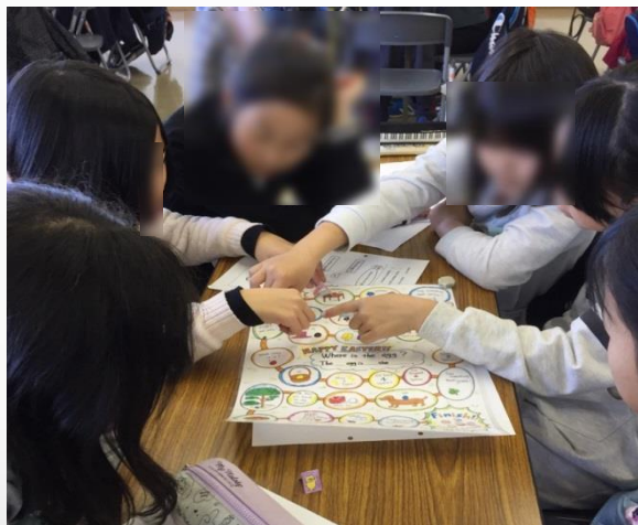
英語ボードゲームに挑戦