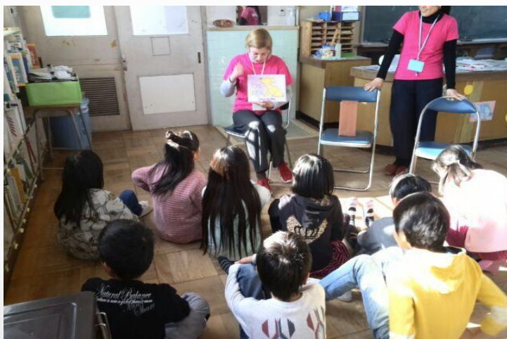
英語の絵本の読み聞かせ