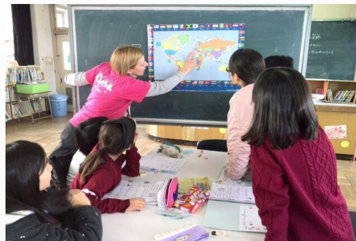
世界の国々について学習