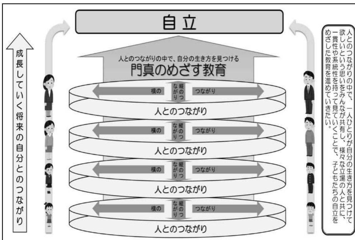
【図1】将来の自立をめざして自分の生き方を見つける教育(審議会のまとめ)

その中で委員から、子どもたちの自立に向けては、人と人とのつながりが大切であり、豊かなつながりの中で育ててほしいという強い思いが述べられ、3つのつながりを軸として、次のとおりまとめました。(図1)