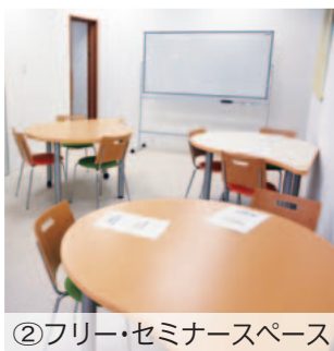
②フリー・セミナースペース