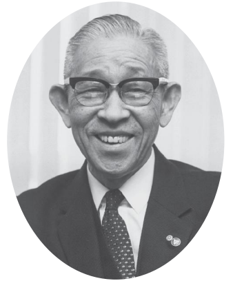
門真市名誉市民 松下 幸之助

明治時代後半から昭和初期にかけて、道路の整備や地域の工業化が進みました。その中で門真市に一際大きな影響を与えたのは、松下幸之助が創業した「松下電器製作所」（現在のパナソニック株式会社）の本店・工場が昭和8年に門真へ移転したことです。これにより、関連する工場や下請け企業が増加し、門真市はものづくりのまちとして大きく変化しました。