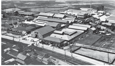
松下電器製作所の建設時