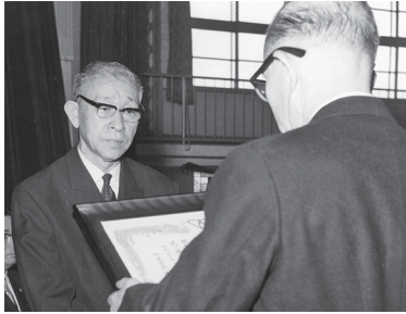
どちらも松下幸之助との縁によるもの