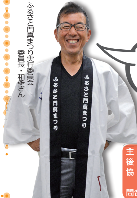
ふるさと門真まつり実行委員会 委員長・和さん

「世代を超えて、多くの市民の皆さんに自分たちの住むこの門真をこよなく愛してもらいたい」「ふるさと意識が高まってほしい」そんなメッセージがいっぱい詰まったまつりです。 仲間や友人、そしてファミリーで、門真の夏を満喫してください。たくさんの笑顔に出会えることを期待しています。