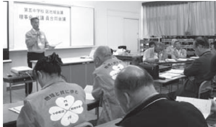
第五中学校区地域会議の活動報告