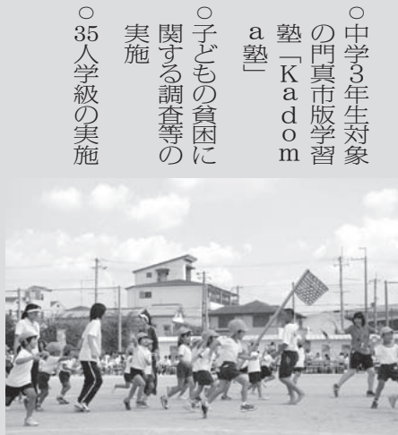
元気よく走る園児たち