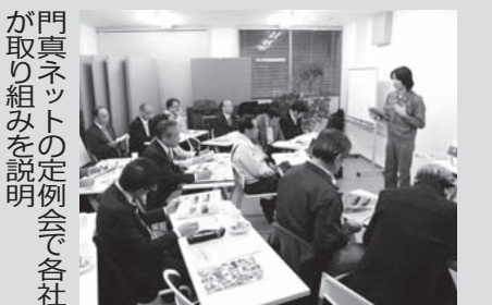
門真ネットの定例会で各社が取り組みを説明