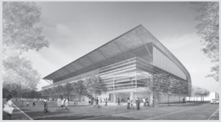
市立総合体育館の完成イメージ図