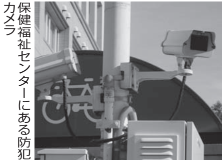
保健福祉センターにある防犯カメラ