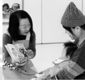
ブックスタートで赤ちゃんに読み聞かせ