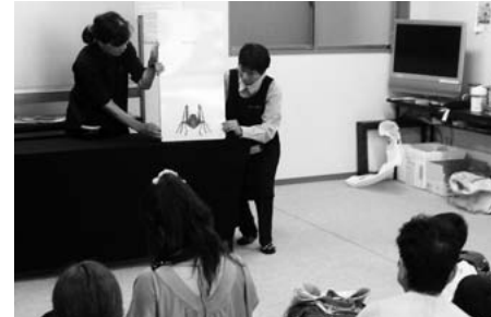
子育てサロンでの読み聞かせ

地域活性化や子どもの読書活動推進のために、地域で、絵本の読み聞かせや紙芝居などを楽しんでもらっています。子育て中のお父さんやお母さん、赤ちゃんや子どもたちから元気をもらって、楽しく活動しています。