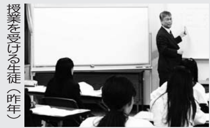
授業を受ける生徒(昨年)

市立中学校の3年生を対象とする門真市中学生放課後学習支援「Kadoma塾」の受講生を募集します。新3年生の皆さん、「Kadoma塾」で夢を形にしませんか。開講期間 4月中旬～29年3月