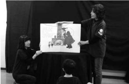
おはなし会で大型絵本を読み聞かせ

私たちは、昭和59年から活動しています。現在は、図書館で年3回おはなし会（絵本の読み聞かせ）を開催しています。絵本を見つめる子どもたちの笑顔が私たちの喜びです。ぜひ一度図書館をのぞいてみてください。