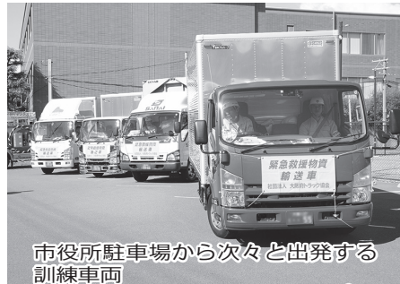
市役所駐車場から次々と出発する訓練車両

市内で、特定の地域の人や外国人に対する差別落書きが発生しました。 差別落書きは、差別をあらわに立てることで、相手を傷つけ、見た人に新たな差別意識を植え付けて、偏見を助長、拡大させるおそれがあり、見過ごすことができないものです。また、落書きは、建造物等損壊罪などや、人権女性政策課 ☎06(6902)6079 その内容によっては、名誉毀損罪、侮辱罪となる場合もあり、決して許されるものではありません。 差別落書きと思われる落書きを発見した場合は、門真市人権女性政策課へ連絡してください。 問合せ 人権女性政策課 ☎06(6902)6079