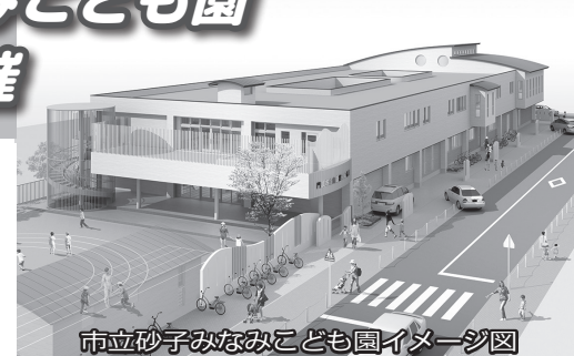
市立砂子みなみこども園イメージ図

※すべての会場で6カ月～未就学児の保育あり。保育を希望する場合は、前日までに電話 ※各会場の駐車場は限りあり。 ※園の名称は9月に開催予定の市議会での議決を経て正式に決定 申込・問合せ先 こども政策課 ☎06(6902)6095