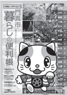
25年度に発行した「門真市暮らしの便利帳」

市は、各種行政サービスの利用手続きや、歴史、医療などの暮らしに役立つ情報を掲載する「門真市暮らしの便利帳」を、公募により決定した株式会社サイネックスと共同で制作し、29年春に全世界帯と事業所への配布を予定しています。