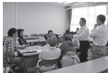
グループワークで話し合う受講生（昨年）

かどま市民大学では、かどまの魅力や取り組みなどを市民の皆さんに知ってもらい、市民力・地域力を育みます。 現在、受講生を募集しています。受講方法は、3つのコースから選択できます。 ○9月5日～28年1月30日の土曜日または水曜日 ※時間は午前10時30分～正午、午後1時～2時30分（1講座1時間30分） ○受講生：各講座の3日前までに直接 ○聴講生：各講座の3日前までに直接 ○総合・専門学部コース：8月21日（金）までの午前9時～午後5時30分に直接 ○聴講生：各講座の3日前までに直接