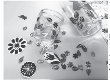
スパンコールや紙ナプキンなどを切り貼りした小物

定員 親子10組(申込順) 持ち物 エプロン、三角巾 費用 無料 申込方法 8月1日(月)～15日(月)に電話 ◆かんたん!かわいいデコページ小物作り とき 9月3日(土)午前10時～正午 対象 市在住・在勤・在学の人 定員 20人(申込順) 持ち物 ジャムの空きびん、陶器、木製の小物入れ、デコパージュしたい物(2～3個)や貼りたい切り抜きなど 費用 無料