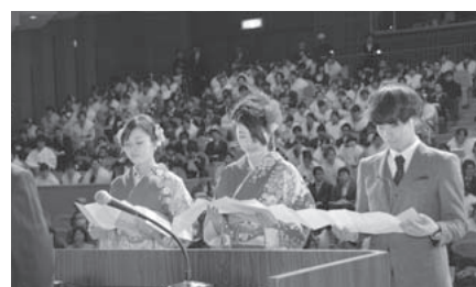
門出の言葉を読み上げる新成人(昨年)

会場には徒歩または公共交通機関でお越しください。会場周辺での駐停車はご遠慮ください。閉会後は速やかに退場してください。