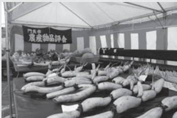
平成27年度門真市農産物品評会の入賞者