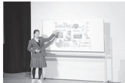
中学生がステージに上がりプレゼン(昨年)

でプレゼンテーションをする15人程度を選考します。 問合せ先 生涯学習課 ☎06(6902)7139