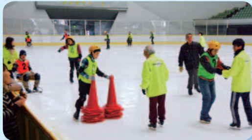
上手に滑れるように練習中