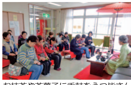
お抹茶や茶菓子を舌鼓をうつ皆さん

いました。初心者の皆さんは、始めはうまく滑れませんでした。練習するうちに、支えがあると多くの人が滑れるようになっていました。また、滑るのに疲れた人はイスぞりに座り、先生やほかの参加者に押しってもらうなど、参加者同士の交流も生まれ、和気あいあいとした雰囲気の良いイベントとなりました。