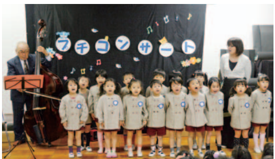
元気な声で大合唱

コンサートは、先生たちのコーラスから始まり、園児が「アルプス一万尺」や「春の小川」などを元気に歌い、続いて保護者らが「雪」を歌いました。