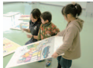
大きなカルタでカルタ取り