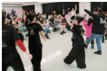
みんなでよさこい

2月22日、リサイクルプラザでエコフェスティバルが開催されました。このイベントは環境意識の啓発を目的に開催され、フリーマーケットや環境クイズ、環境に関するパネル展示、廃材を利用したミニカーやバッジ作りなど、さまざまなコーナーが設けられました。来場した皆さんは、クイズに頭を悩ませたり、バッジ作りに熱中したり、環境を意識しつつもイベントを楽しんでいました。ほかにも子どもたちが巨大な防災カルタで獲れた枚数を競ったり、舞台発表のよさこいでは来場した人も一緒に踊るなど、にぎやかなイベントとなりました。