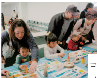
廃材でミニカーやバッジ作り