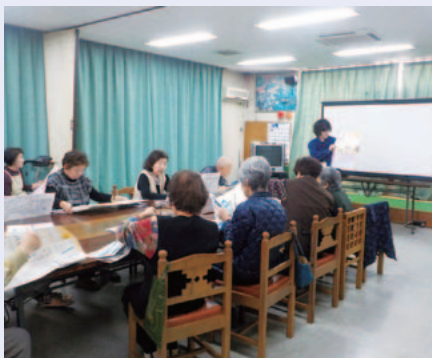
岸和田南住宅自治会館で防災講話

3月24日、岸和田南住宅自治会館で、四宮校区福祉委員会主催の防災講話が実施されました。当日は、DVDの放映や門真市洪水ハザードマップ・防災マップを用いた市職員の説明などがあり、質問コーナーでは参加者から多くの質問が出されるなど、防災について改めて考える有意義な時間となりました。