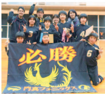
門真フェニックス