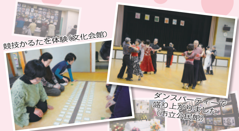
競技かるたを体験(文化会館)