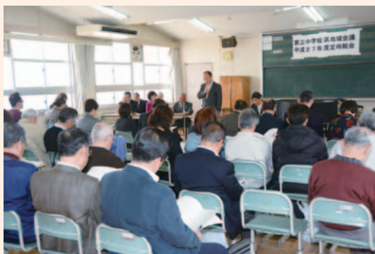
28年度事業計画などを説明

28年度は子育て・教育、防災、環境など、多岐の分野にわたる21の事業が計画されています。