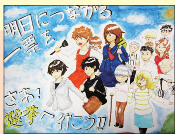
門真市最優秀作品