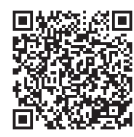
2020年国勢調査 ホームページは こちら