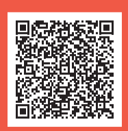
ステンレス製ボトル 回収ボックス