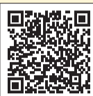
主要事業はこちら