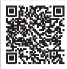
施政方針はこちら