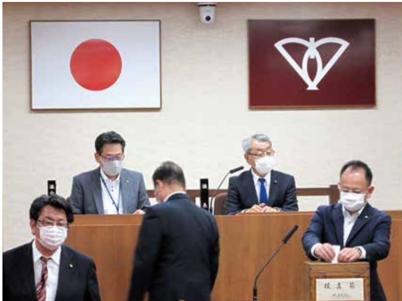
役員選挙の投票の様子

が、それぞれ当選並びに選任に同意されました。 また、各常任委員会委員、議会運営委員会委員及び組合議会議員等についても、4ページに掲載のとおり決定しました。 このほか、市長提出議案13件、議員提出議案1件についても原案のとおり可決及び承認しました。