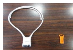
↑ ネックライトと防犯ホイッスル