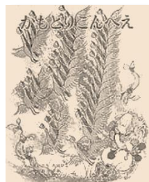
「かもとりごんべえ」