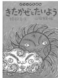
「きたかぜとたいよう」

たのしいよみもの れいぞうこ、じてんしゃ、でんわやパンツ。このお話の中では ものがうごいて、なにやらはなし始めて……。