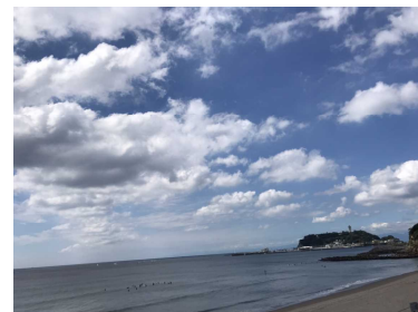
(鎌倉・遠くに江ノ島が見えます)

何より嬉しかったのは、3年生の皆さんの弾けるような笑顔がたくさん見ることができたことです。クラスの仲間や友達、先生方との「心の距離」が一層縮まったのではないのでしょうか。いい思い出ができましたね。いろんな人に「修学旅行は楽しかったですか？」と尋ねたら、全員口をそろえて「楽しかったです!」と答えてくれました。本当に良かったなと思いました。この修学旅行を成功させるために、様々な役割を担当してくれた各委員、班長、室長の皆さん、ありがとう。皆さんのおかげで充実した修学旅行になりました。反省点も少しありました。時々ハメを外しすぎる場面があったこと、人の話を静かに聞けない人がいたことなどです。今後の反省材料にしましょう。