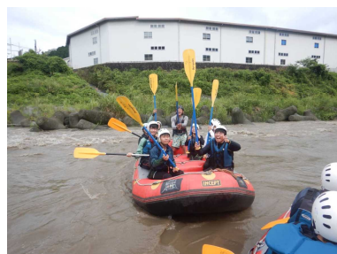
(ラフティングに出発!)

早朝5時50分に学校集合。歩いて「グリーンベルト」に移動し、バスに乗車。いざ富士山方面へ。約6時間の長旅でしたが、文化委員制作の楽しいDVDや音楽を楽しみました。途中トイレ休憩を2回とり、清水PAで昼食のお弁当をいただきました。あいにく雨上がりで地面が濡れていたため、バス内で昼食をとりました。