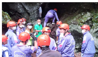
(ヘルメットをかぶり洞窟へ)

朝、目覚めるとホテルの正面に雄大な富士山がよく見えました。9月なのでまだ積雪はしていませんが、そのスケールに圧倒されます。朝食の後、バスに乗り、樹海・洞窟探検に出発。樹海の中をかなり歩き(途中の木にはクマの爪の跡が)、洞窟に到着。ヘルメットをかぶり、説明を聞き、洞窟に入りま