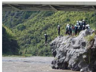
(勇気を振り絞って飛び込み!)

朝、目覚めるとホテルの正面に雄大な富士山がよく見えました。9月なのでまだ積雪はしていませんが、そのスケールに圧倒されます。朝食の後、バスに乗り、樹海・洞窟探検に出発。樹海の中をかなり歩き(途中の木にはクマの爪の跡が)、洞窟に到着。ヘルメットをかぶり、説明を聞き、洞窟に入りま