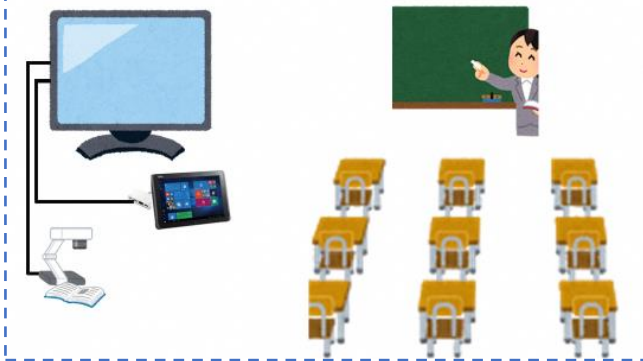
従来の教室イメージ（現状）

←これまでは、黒板の板書に加えて先生のパソコン画面をテレビ等に映すことはできました