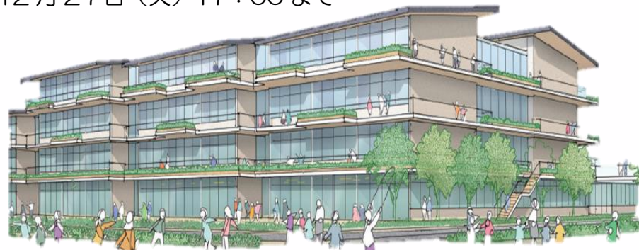
※イメージ図 今後変更する可能性があります。

応募箱に投函 市HPの応募フォームから応募 FAX (06-6900-2323)