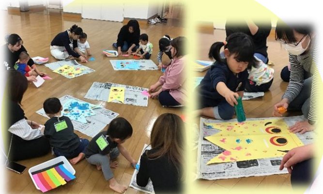
こいのぼり製作をしました！