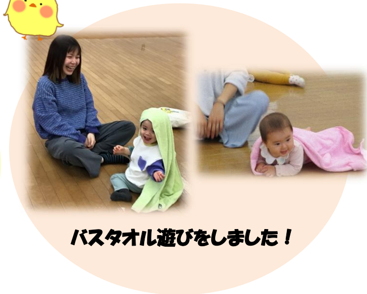
バスタオル遊びをしました！