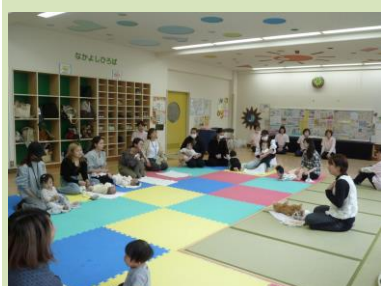
10/31 ぴよぴよクラブ （ベビーマッサージ）