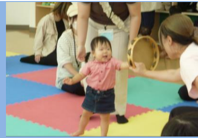
10/17 リールキッズ門真保育園 （ハロウィンおおさわぎ）