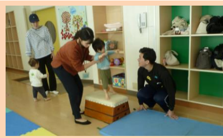
10/23 おおわだ保育園 （サーキットあそび）