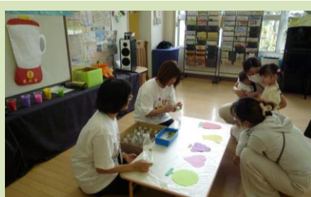
10/15 さくら幼稚園 （ジュースごっこを楽しもう）