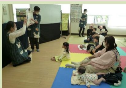
10/21 あおぞら保育 （ふれあい遊び・ミニシアター他）