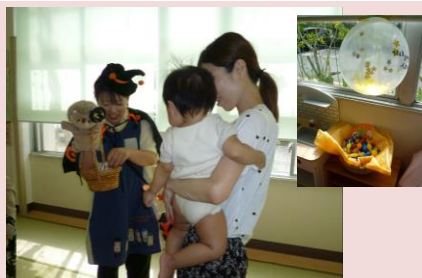
10/14 ミツ島保育所（ハロウィンごっこ）