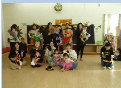
10/30 親子で English （ハロウィンを楽しみました）