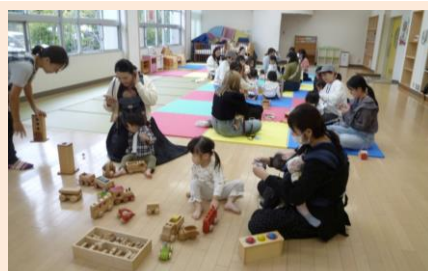
10/22 麦の子共同保育園 （ふれあい遊び・木のおもちゃ他）