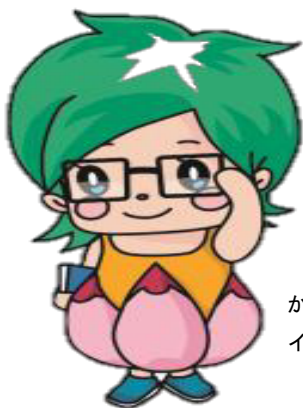
かどま地域通貨「蓮」 イメージキャラクター 「蓮ちゃん」

受付時間：午前 9 時から午後 5 時 30 分まで（土曜日、日曜日、祝日を除く）