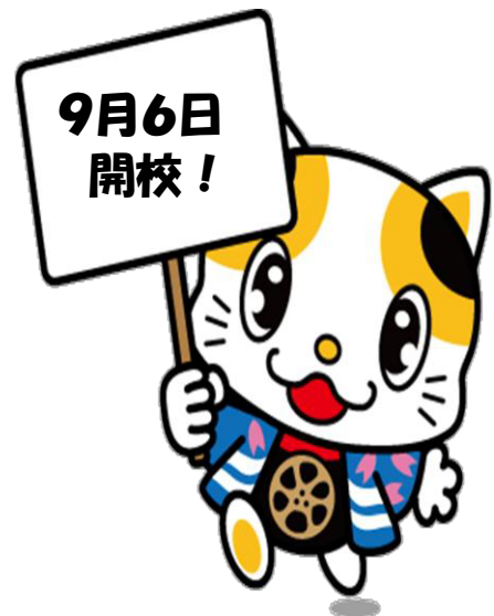
門真市イメージキャラクター 「ガラスケ」