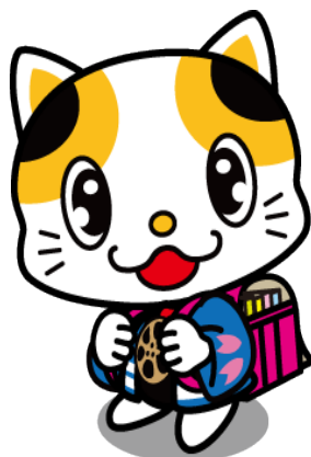
門真市イメージキャラクター 「ガラスケ」

かどま市民大学は、門真市から NPO 法人あいまち門真ステーションへ、事業運営を委託しています。