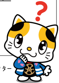
門真市イメージキャラクター 「ガラスケ」

※原則、市在住・在勤・在学・市内で公益活動を行う人 または行おうとする人で、18歳以上の方が対象となります。