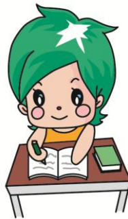
かどま地域通貨「蓮」 イメージキャラクター 「蓮ちゃん」